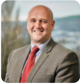
Dafydd Llywelyn Comisiynydd yr Heddlu a Throseddu

Rwy'n deall y gall dioddef trosedd fod yn brofiad trawmatig, ac weithiau, gall newid bywyd. Un o'r blaenoriaethau a nodir yn fy Nghynllun Heddlu a Throseddu yw cefnogi dioddefwyr, ac rwyf wedi ymrwymo i sicrhau bod pob dioddefydd yn cael ei gydnabod, ei ddiogelu a'i gefnogi, ac yn derbyn gwasanaeth wedi'i deilwra i'w anghenion unigol.