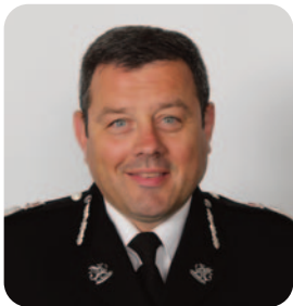
Ifan Charles Prif Gwnstabl

Mae'r pecyn hwn yn cynnwys gwybodaeth bwysig y gall fod ei hangen arnoch nawr eich bod chi wedi adrodd am drosedd wrth yr heddlu. Mae hefyd yn nodi'r cymorth sydd ar gael ichi, a byddwn yn eich annog i ystyried ymgysylltu â'r gwasanaethau cymorth arbenigol y rhoddir manylion amdanynt. Rwy'n gobeithio bod y wybodaeth hon yn eich helpu i deimlo'n wybodus a'ch bod chi'n cael eich cefnogi bob cam o'r ffordd.